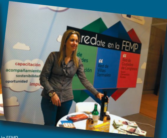
Alcaldes de diversos municipios celebraron sus reuniones de trabajo en el stand de la FEMP.